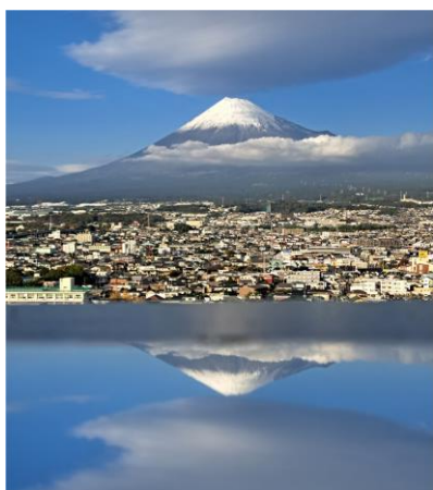
富士市役所の屋上からの写真

2/6（木）富士市障害者自立支援協議会「全体会議」が開催されました。富士市の全体会議には、当事者や事業所の方々が集まり、各部会や連絡会の報告をします。また、テーマを決めグループワークをおこないました。様々な人たちが集まることで有意義な意見交換が出来、改めてそれぞれの想いを知る機会にもなりました。横つながりから、縦のつながりになり、支援の輪になると良いと思いました。（北館）